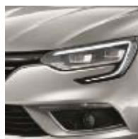
Gris Platine (D69)