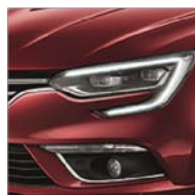
Rouge Intense (NPK)