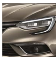
Beige Dune (HNP)