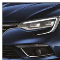
Bleu Cosmos (RPR)