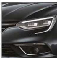
Gris Titanium (KPN)