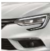
Blanc Glacier (369 - opacă)