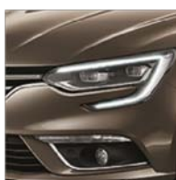
Brun Vision (CNM)