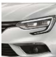
Blanc Glacier (369 - opacă)