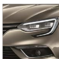
Beige Dune (HNP)