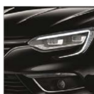
Noir Etoilé (GNE)