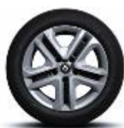
Jante oțel 16" Flexwheel, design Complea