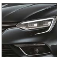
Gris Titanium (KPN)