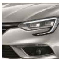
Gris Platine (D69)