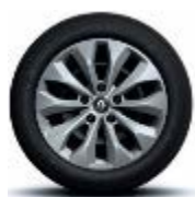
Jante oțel 16", design Florida