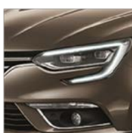
Brun Vision (CNM)