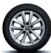
Jante aliaj 16", design Silverline