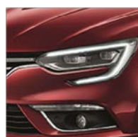
Rouge Intense (NPK)