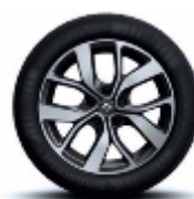
Jante aliaj 17", design Celsius