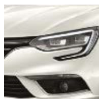
Blanc Nacré (QNC)