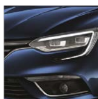
Bleu Cosmos (RPR)