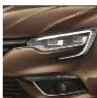
Brun Cappuccino (CNL) Indisponibilă pentru pachetul GT Line