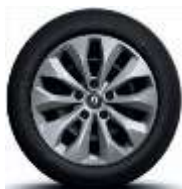
Jante oțel 16", design Florida