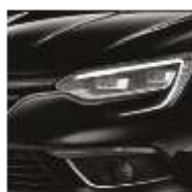
Noir Etoilé (GNE)