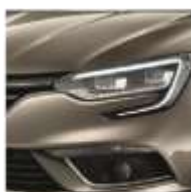
Beige Dune (HNP) Indisponibilă pentru pachetul GT Line