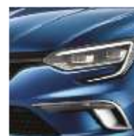
Bleu Iron (RQH) Disponibilă doar pentru pachetul GT Line