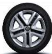
Jante oțel 16" Flexwheel, design Complea