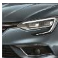
Bleu Berlin (RQE)