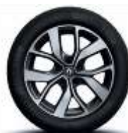
Jante aliaj 17", design Celsius