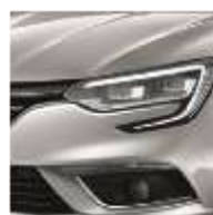
Gris Platine (D69)