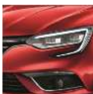
Rouge Flamme (NNP)