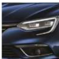
Bleu Cosmos (RPR) Indisponibilă pentru pachetul GT Line