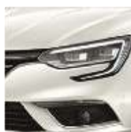
Blanc Nacré (QNC)