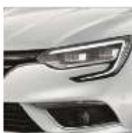
Blanc Glacier (369 - opacă)