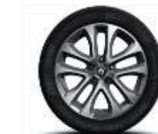
Jante aliaj 17" specific GT, design Decaro