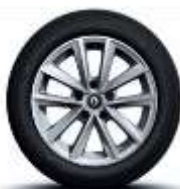
Jante aliaj 16", design Silverline