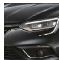
Gris Titanium (KPN)