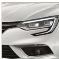
Blanc Glacier (369 - opacă)