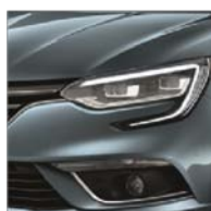
Bleu Berlin (RQE)