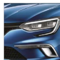
Bleu Iron (RQH) Disponibilă doar pentru pachetul GT Line