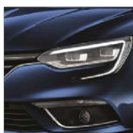
Bleu Cosmos (RPR) Indisponibilă pentru pachetul GT Line