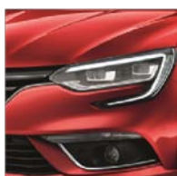
Rouge Flamme (NNP)