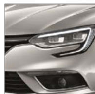
Gris Platine (D69)