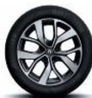
Jante aliaj 17", design Celsius