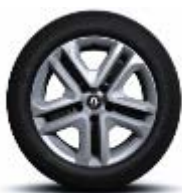
Jante oțel 16" Flexwheel, design Complea