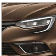
Brun Cappuccino (CNL) Indisponibilă pentru pachetul GT Line