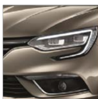
Beige Dune (HNP) Indisponibilă pentru pachetul GT Line