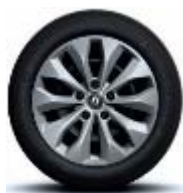
Jante oțel 16", design Florida