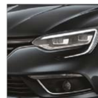
Gris Titanium (KPN)