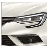
Blanc Nacré (QNC)