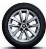
Jante aliaj 16", design Silverline