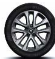
Jante aliaj 17" specific GT, design Decaro