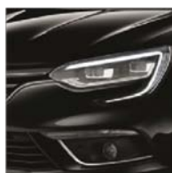
Noir Etoilé (GNE)