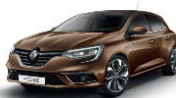
Brun Cappuccino (CNL) Indisponibil GT