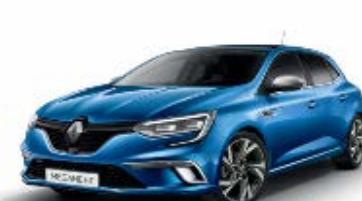
Bleu Iron (RQH) Doar pentru GT