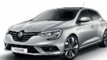
Gris Platine (D69)