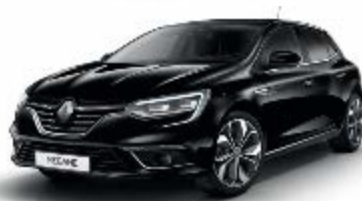
Noir Étoilé (GNE)