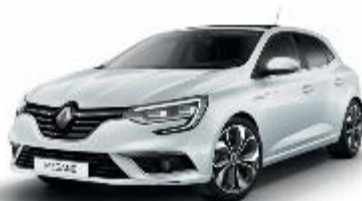
Blanc Glacier (369 - opacă)