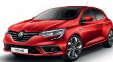
Rouge Flamme (NNP)