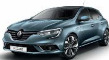
Bleu Berlin (ROE)