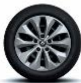
Jante oțel 16" design Florida