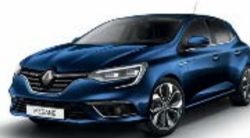
Bleu Cosmos (RPR) Indisponibil GT