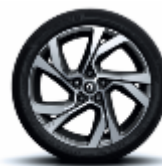
Jante aliaj 18" design Magny Cours