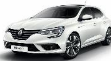
Blanc Nacré (QNC)