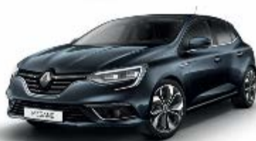
Gris Titanium (KPN)