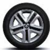
Jante oțel 16" Flexwheel, design Complea