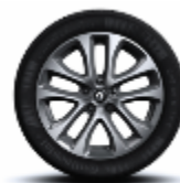
Jante aliaj 17" specific GT, design Decaro