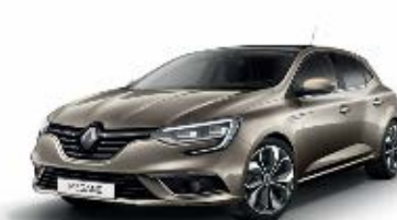
Beige Dune (HNP) Indisponibil GT