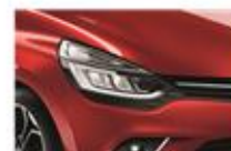
Roșu "Flamme" (NNP)