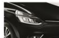
Negru "Etoile" (GNE)

* Cuprinde țările: Austria, Bosnia și Herțegovina, Belgia, Bulgaria, Elveția, Republica Cehă, Germania, Estonia, Finlanda, Guyana Franceză, Guadaloupe, Grecia, Croația, Ungaria, Islanda, Italia, Liechtenstein, Lituania, Luxemburg, Letonia, Moldova, Muntenegru, Macedonia, Martinica, Olanda, Norvegia, Danemarca, Polonia, Reunion, România, Serbia, Suedia, Slovenia, Slovacia, San Marino, Turcia, Vatican.