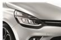
Gri "Platine" (D69)