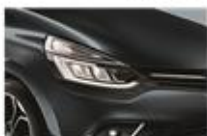
Gri "Titanium" (KPN)