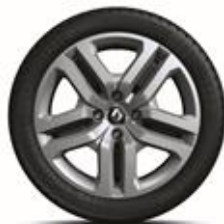
RDIF28 Jante Flex Wheel 16" "ATTRACTIVE" (standard pe versiunea ZEN)