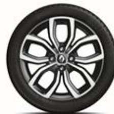
RDIF31 Jante de aliaj 16" "PULSIZE" gri diamantate