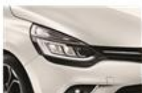
Alb "Nacre" (QNC)