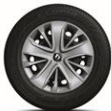
RDIF24 Jante din oțel de 15" cu capace "LAGOON" (standard pe versiunea LIFE)