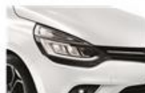
Alb "Glacier" (369)