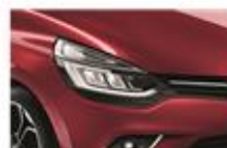
Roșu "Intense" (NPK)