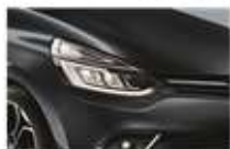
Gri "Titanium" (KPN)