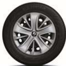
RDIF24 Jante din oțel de 15" cu capace "LAGOON" (standard pe versiunea LIFE)