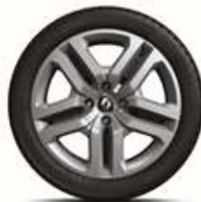
RDIF28 Jante Flex Wheel 16" "ATTRACTIVE" (standard pe versiunea ZEN)