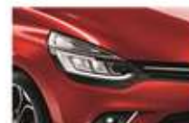
Roșu "Flamme" (NNP)