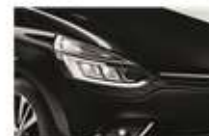
Negru "Etoile" (GNE)

* Cuprinde țările: Austria, Bosnia și Herțegovina, Belgia, Bulgaria, Elveția, Republica Cehă, Germania, Estonia, Finlanda, Guyana Franceză, Guadaloupe, Grecia, Croația, Ungaria, Islanda, Italia, Liechtenstein, Lituania, Luxemburg, Letonia, Moldova, Muntenegru, Macedonia, Martinica, Olanda, Norvegia, Danemarca, Polonia, Reunion, România, Serbia, Suedia, Slovenia, Slovacia, San Marino, Turcia, Vatican.