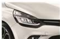
Alb "Nacre" (QNC)