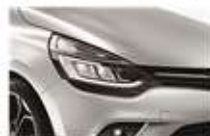
Gri "Platine" (D69)