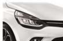
Alb "Glacier" (369)