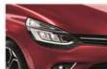
Roșu "Intense" (NPK)