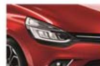
Roșu "Flamme" (NNP)