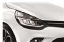
Alb "Glacier" (369)