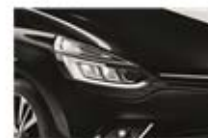
Negru "Etoile" (GNE)

* Cuprinde țările: Austria, Bosnia și Herțegovina, Belgia, Bulgaria, Elveția, Republica Cehă, Germania, Estonia, Finlanda, Guyana Franceză, Guadaloupe, Grecia, Croația, Ungaria, Islanda, Italia, Liechtenstein, Lituania, Luxemburg, Letonia, Moldova, Muntenegru, Macedonia, Martinica, Olanda, Norvegia, Danemarca, Polonia, Reunion, România, Serbia, Suedia, Slovenia, Slovacia, San Marino, Turcia, Vatican.