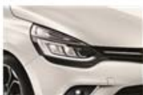
Alb "Nacre" (QNC)