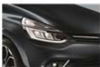
Gri "Titanium" (KPN)