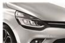
Gri "Platine" (D69)