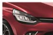
Roșu "Intense" (NPK)